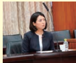
厚生労働委員会質問

看護の現場の声を国政に! 本年が皆さまにとってよりよい一年となりますよう祈念致します。