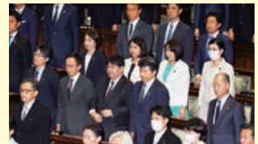
第212回臨時国会開会式