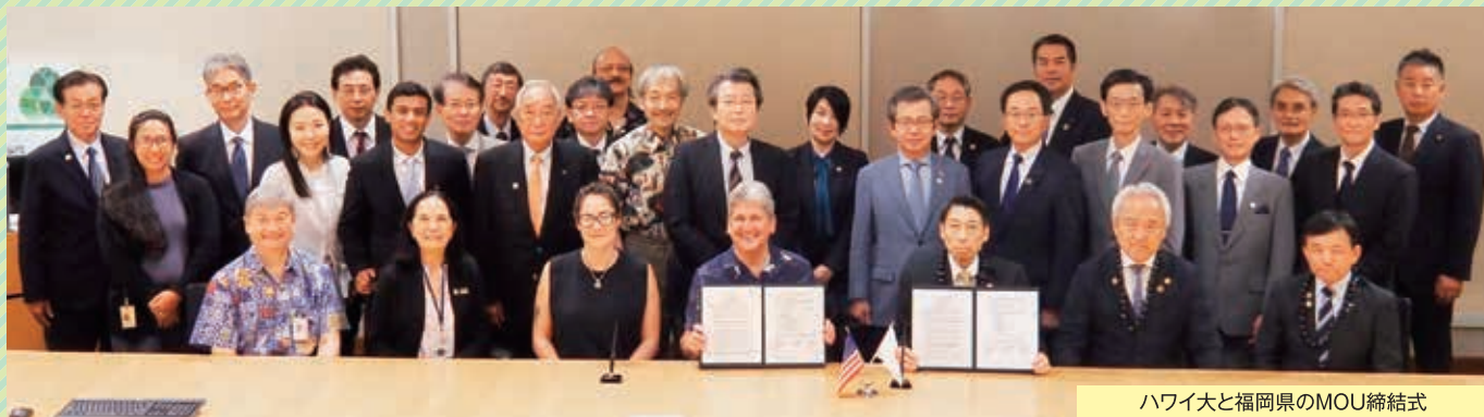
ハワイ大と福岡県のMOU締結式