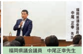
福岡県議会議員 中尾正幸先生