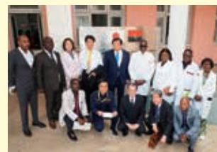
IPU会議にアンゴラ出張