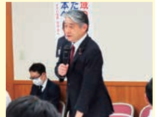
予算・税制等に関する政策懇談会にて

基本的な指針」が31年振りに改定されました。これは、日本看護連盟・日本看護協会から指針改定の要望が看護問題小委員会に提出され、政府へ改定を要請した賜物です。看護師の確保推進という指針の目的を果たすため、時代に即した指針への改定が実現しました。