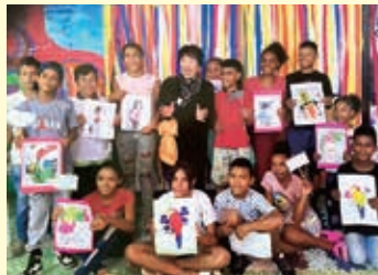
コロンビアの避難民施設にて