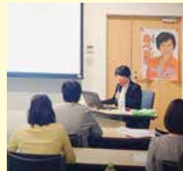
看護師の方々との勉強会

子どもたちの心身を健やかに伸ばすことができる教育文部科学行政に全力で取り組んで参ります。時代が大きく動いていますが、いつの時も政策立案の基本となるのは現場の声です。人や社会を支える看護が時勢に基づいて変革することを貴連盟の皆様と共に支えて参りたいと存じます。