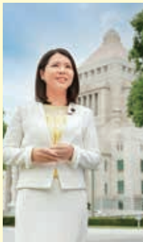
国会議事堂をバックに