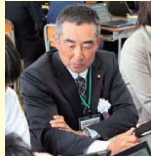
中学生からのプレゼン

のか、若者が政治への関心を高められるのかなどについて、ディスカッションを行いました。中学生とは思えないような実践的な企画を提案され、大変驚きましたが、若い皆さん方からのエネルギーに圧倒されました。義務教育のICT導入は、等しく教育を受けるためのツールとして、また、これからの人材育成において、無くてはならないものと強く感じました。